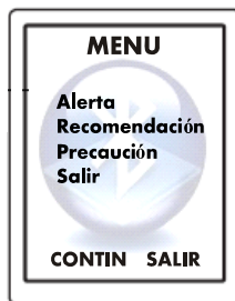
Fig. 1. Interfaz del Usuario.

La interfaz de los teléfonos celulares deberá ser diseñada de tal manera que sea compatible con las características de despliegue y operación de la mayoría de las marcas de teléfonos, es decir en modo de texto y con selección por menú, utilizando los botones de desplazamiento convencionales. Ver Fig. 1.